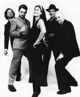
DI GRINE KUZINE klezmer balkan brass

Jetzt kommt Di Grine Kuzine nach Offenburg - am 6. Juni im Spitalkeller - da bleibt nur noch zu sagen: Hingehen und Musik hören, die süchtig machen kann!